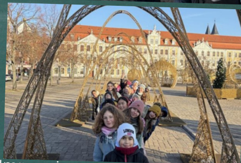
Impressionen: Projektwoche 6er